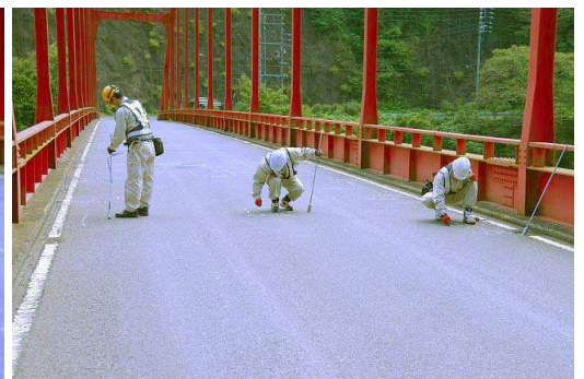
<アイハンマー写真>